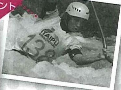
(右) パドル一本で激流を制す、究極テクニック! (左) おちやめなオフショットスマイル♪