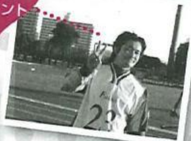
(右) 相手チームの隙を突いて打つ強烈シュート (左) 目尻が下がりぎみの笑顔が可愛い！