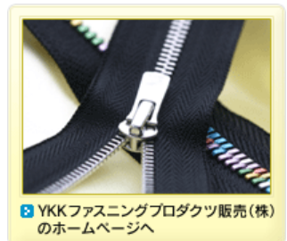
YKKファスニングプロダクツ販売(株)のホームページへ

http://www.ykk.com/japanese/ykk/here/index.html